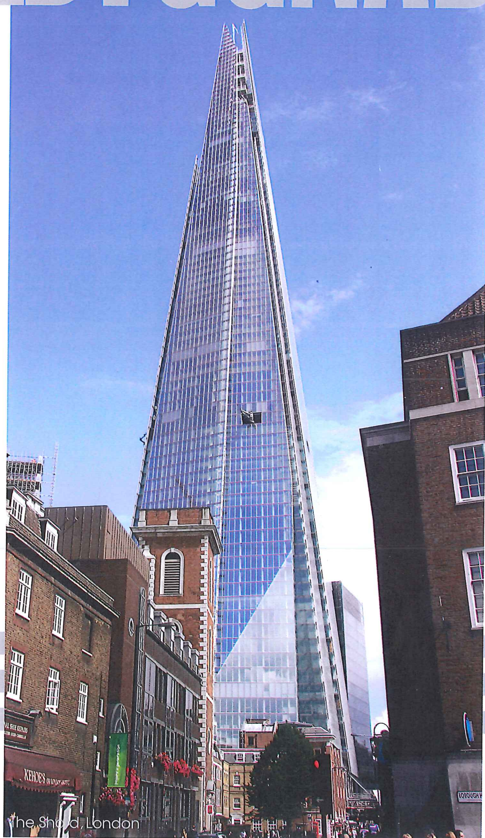
The Shard, London