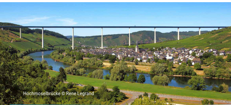
Hochmoselbrücke