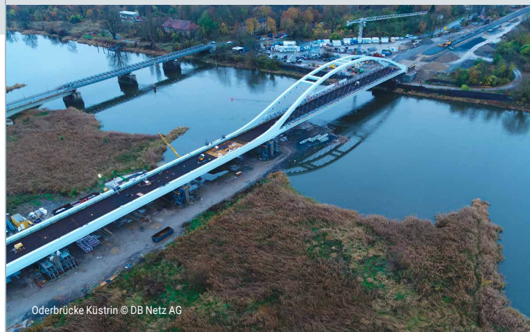
Oderbrücke Küstrin