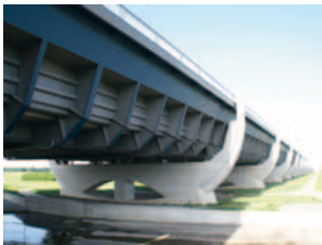
2002 Kanalbrücke Magdeburg Deutschland / Europa