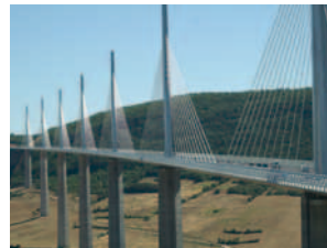
2004 Millau-Viadukt Frankreich / Europa