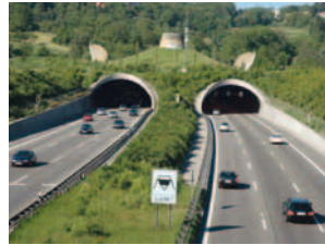
1999 Engelbergbasistunnel Deutschland / Europa