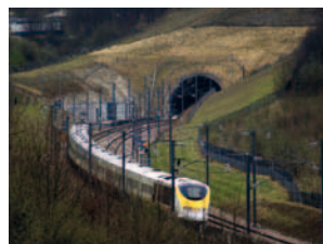
2007 High Speed 1 England / Europa