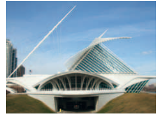
2001 Milwaukee Art Museum USA / Amerika