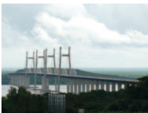
2006 Orinoquia-Brücke Venezuela / Amerika