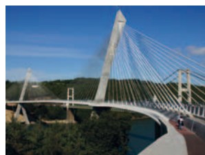
2011 Térénez-Brücke Frankreich / Europa