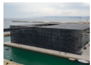
2013 MuCEM Frankreich / Europa