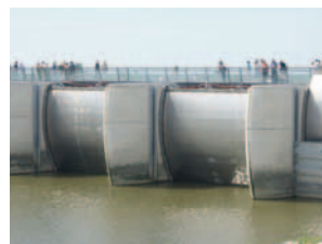
2008 Caserne-Staudamm Frankreich / Europa