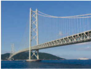
1998 Akashi-Kaikyo-Brücke Japan / Asien

Structurae ist ein einzigartiges Informationsnetzwerk und Recherchetool für praktisch tätige Bauingenieure und Studenten der Fachrichtung Bauingenieurwesen, sowie für Architekten und andere Fachleute im Bausektor. Seit 15 Jahren bietet Structurae ausführliche Informationen zu über 60.000 Bauwerken. Nachfolgend zeigen wir Ihnen eine kleine Auswahl – für jedes Jahr seit der Gründung von Structurae ein Bauwerk.