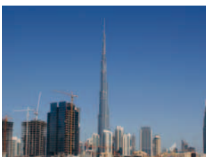
2010 Burj Khalifa UAE / Europa