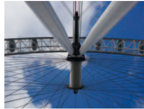
2000 London Eye England / Europa