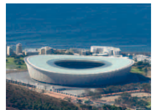
2009 Kapstadt-Stadion Süd-Afrika