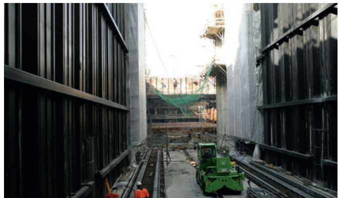
Bild 3. Kaiserschleuse Bremerhaven – Schleusenammer mit Binnenhaupt