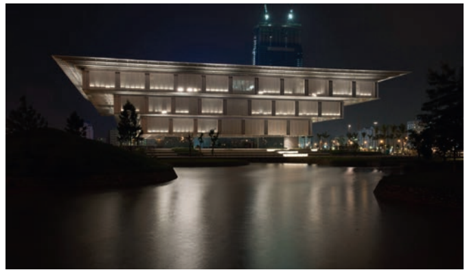
Bild 2. Museum für Stadtgeschichte Hanoi, Architektur: gmp (von Gerkan, Mark und Partner) – INROS LACKNER war hier für die Tragwerksplanung und Technische Gebäudeausrüstung verantwortlich