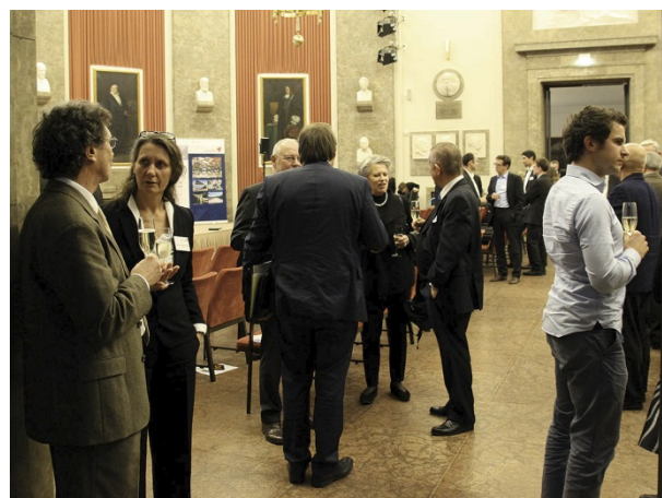
Angeregte Gespräche beim Sektempfang im Anschluss an die Preisverleihung.