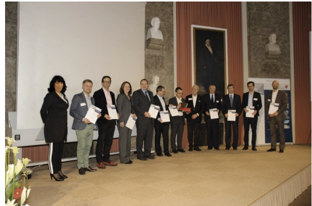
Ehrung des Projektteams „Kaeng Krachan Elefantenpark, Zoo Zürich“