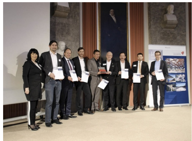
Das Projektteam „Eisenbahnüberführung Grubentalbrücke“