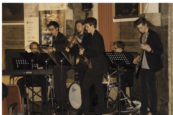
Die LOZZI Jazz Combo umrahmt die Preisverleihung musikalisch.