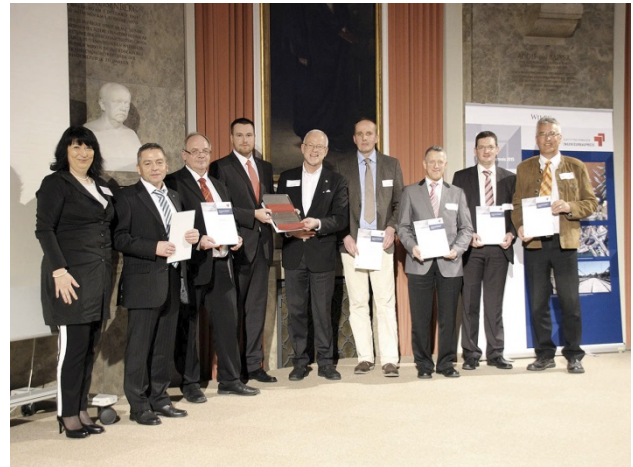
Das Projektteam „Saarbrücke Mettlach“