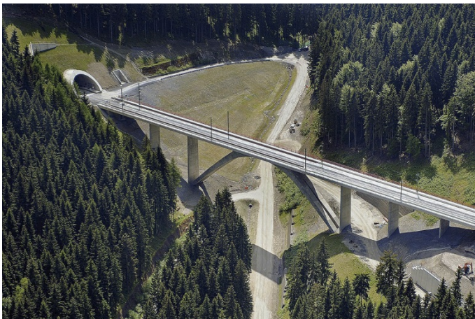
Das Projekt Eisenbahnüberführung Grubentalbrücke, Goldisthal im Thüringer Wald, erhielt eine Auszeichnung