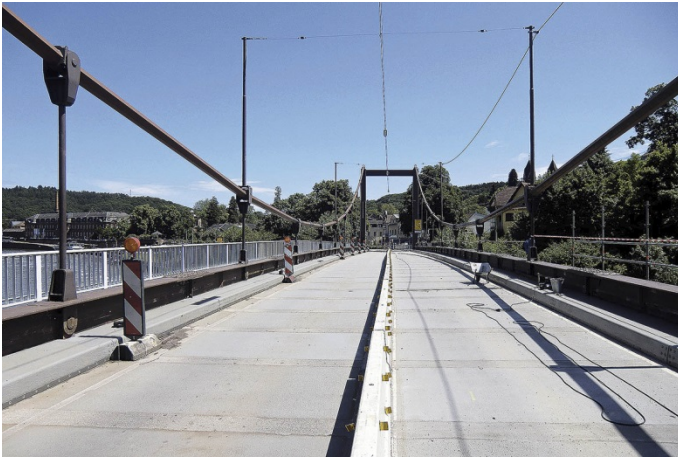
Das Projekt Sanierung und Instandsetzung der Saarbrücke Mettlach erhielt eine Auszeichnung