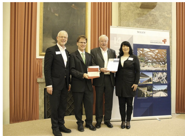
Das Projektteam „Ultimate Trough Test Loop, Kalifornien“