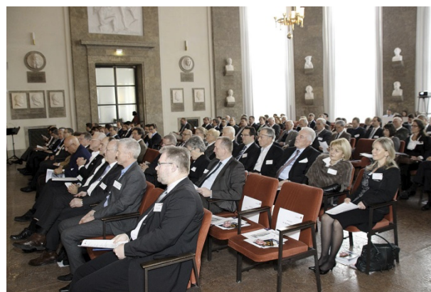
Im Ehrensaal des Deutschen Museums