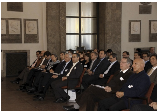
Das Publikum im Ehrensaal des Deutschen Museums München