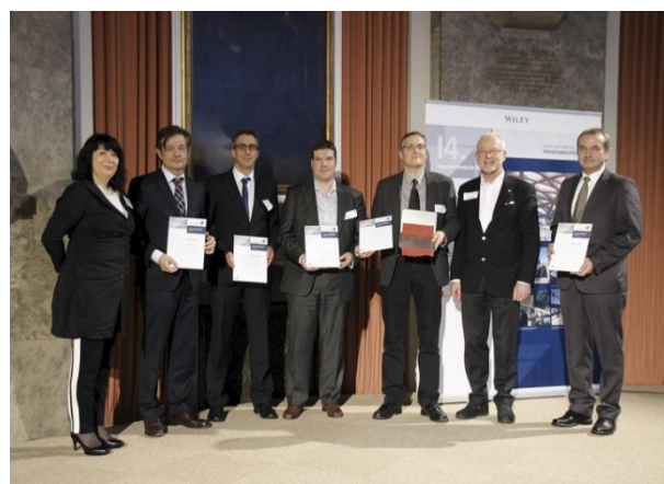
Das Projektteam „Baugruben zur Erweiterung des Rheinkraftwerks Iffezheim“