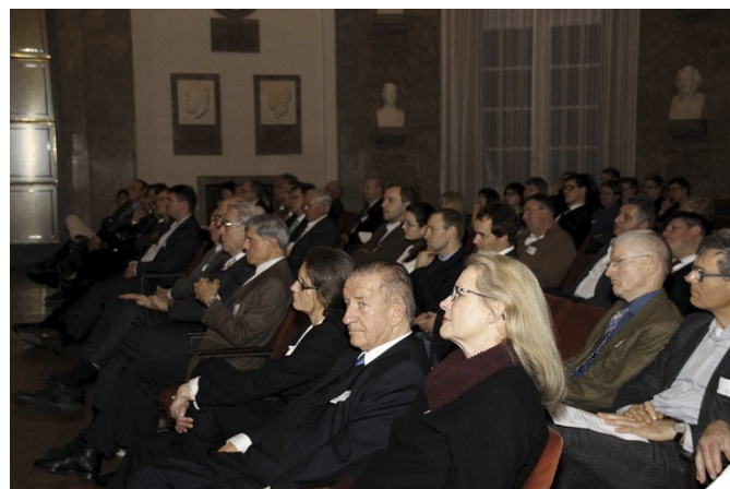
Publikum im Ehrensaal des Deutschen Museums