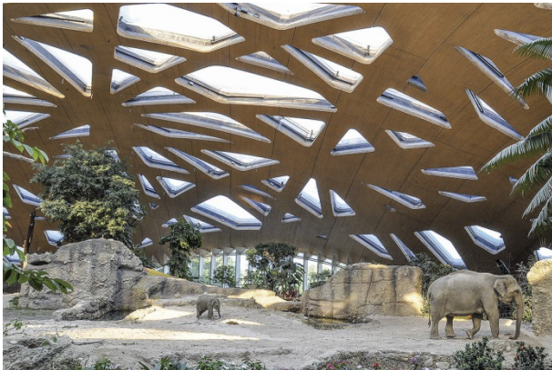
Der Preisträger: Kaeng Krachan Elefantenpark, Zoo Zürich