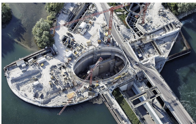
Das Projekt Baugruben zur Erweiterung des Rheinkraftwerks Iffezheim erhielt eine Auszeichnung