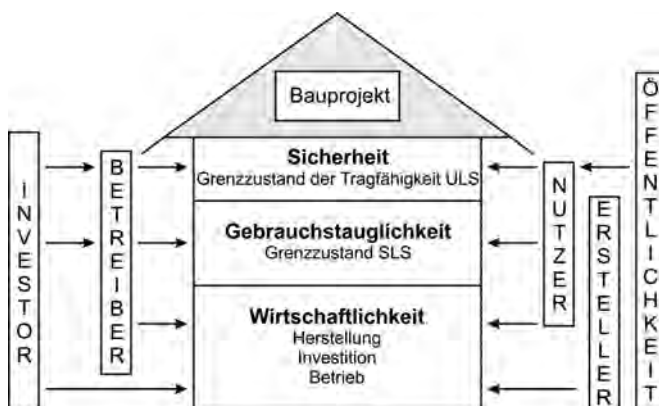
Bild 1 Anforderungen und Beteiligte bei einem Bauprojekt

Ähnliche Spannungsfelder ergeben sich auch zwischen Investor und Bauausführendem, Betreiber und Nutzer, aber auch im Verhältnis zur allgemeinen Öffentlichkeit. Konflikte treten in diesem Zusammenhang insbesondere im Hinblick auf die Bewertung der Sicherheitsanforderungen an ein Bauwerk auf. Die Allgemeinheit fordert schnell die Einhaltung höchster Sicherheitsvorkehrungen, muss dafür aber zumindest vordergründig meistens nicht direkt ins finanzielle Obligo bei der Umsetzung treten. Dabei ist die Verbesserung eines bereits hohen Sicherheitsniveaus ungleich schwieriger und vor allem kostspieliger als ein entsprechender Sicherheitszuwachs von geringerem Niveau